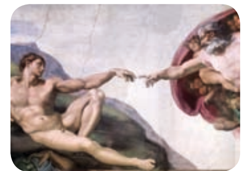
La creación de Adán, bóveda de la capilla Sixtina