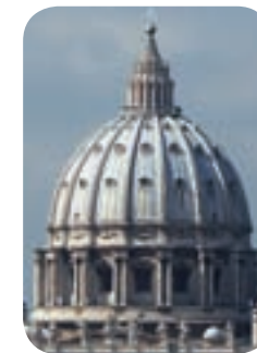
La cúpula de San Pedro del Vaticano