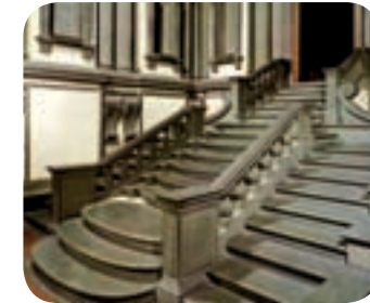
Escalera de la Biblioteca Laurenziana